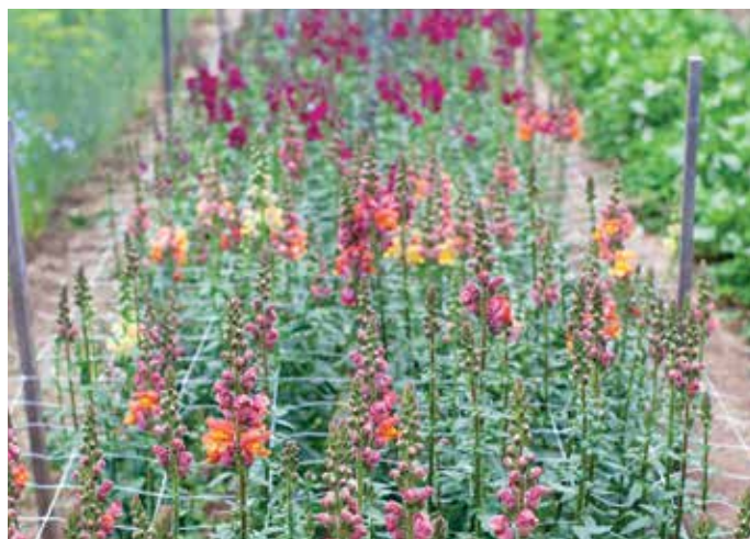
FIGURA 5. La malla ayuda a asegurar tallos rectos en los dragones (Hortonova trellis, Peaceful Farm Supply).

Una dilución de algas marinas en líquido promueve el robustecimiento de las hojas y del tallo, lo que conduce a tallos más largos, robustos, y resistentes. Es fácil de usar en combinación con una fuente de nitrógeno en líquido tal como la emulsión de pescado o un producto a base de soya. Haga aplicaciones foliares semanales usando una rociadora o aspersora de mochila para la mayoría de las flores de corte. Deje de fertilizar una vez establecido el crecimiento vegetativo a fin de no retrasar la floración o el desarrollo de tallos y flores que se caen o dañan con facilidad. Tenga en cuenta que los girasoles no deben recibir fertilidad suplementaria;